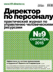
“Директор по персоналу”